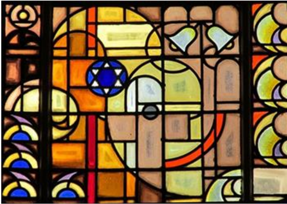
Paasraam Willem de Zwijgerkerk, Kees Kuiler, 1931

Zoals we al met u deelden zijn we als klankbordgroep en kerkenraad informeel bij elkaar geweest om na te denken over onze visie op de toekomst van de Willem de Zwijgerkerk. Dat leidt nog niet meteen tot een voorstel om met u te delen. Maar er zijn wel een paar conclusies mogelijk.