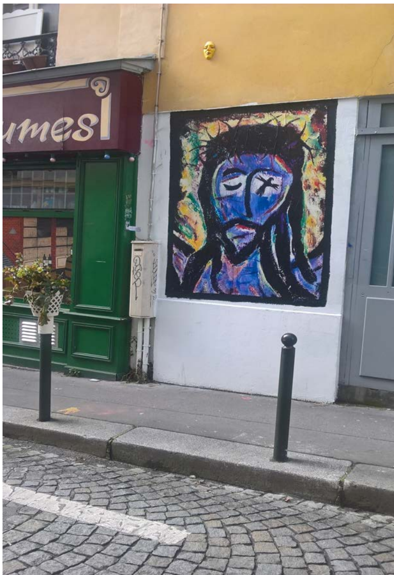
© Bea Stoker-Klein - Street art ergens in Parijs