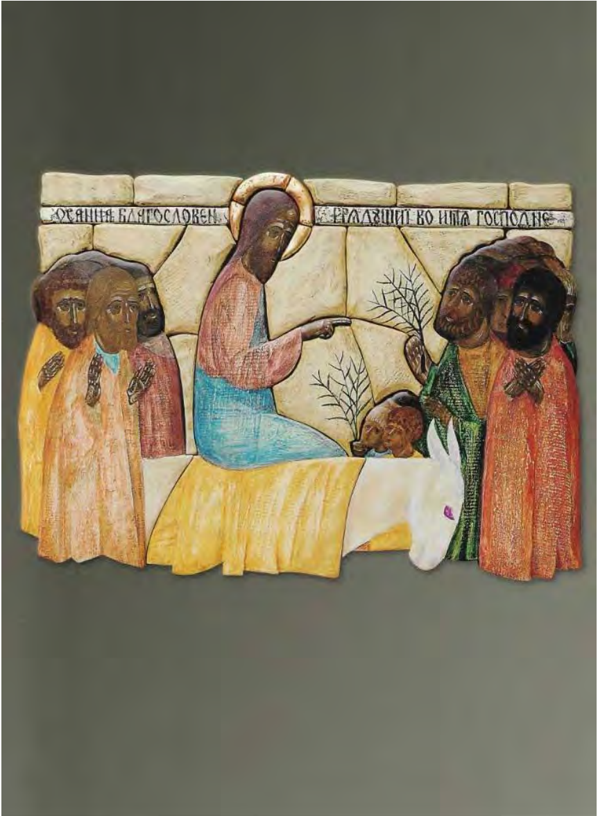
Wasili Wasin, The Last Supper (2005)