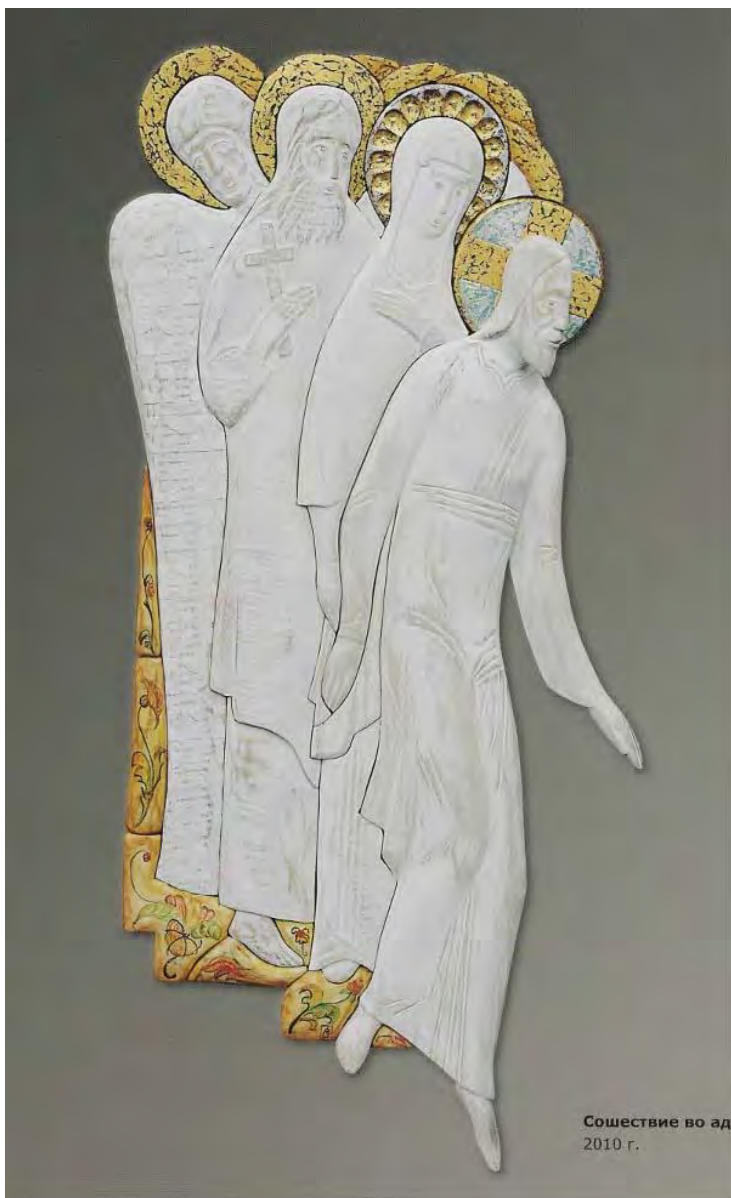
Wasili Wasin, The Anastasis (2010)