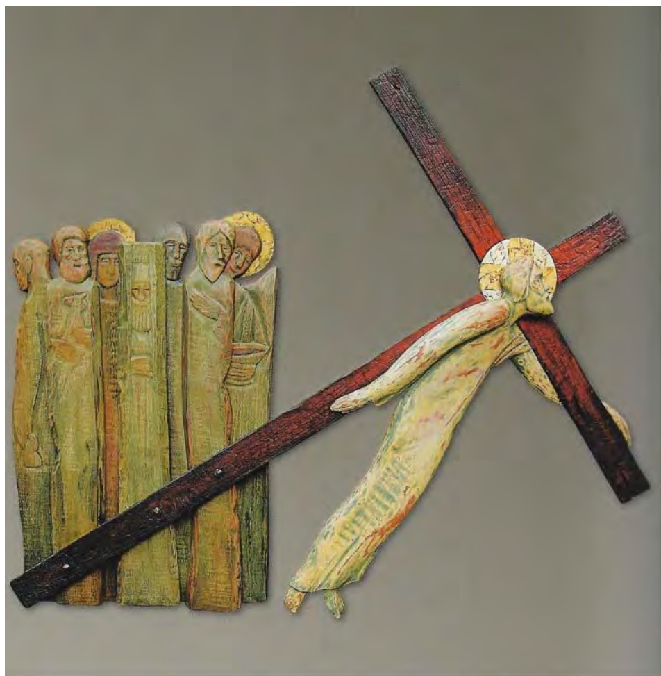
Wasili Wasin, Way of the Cross (2012)