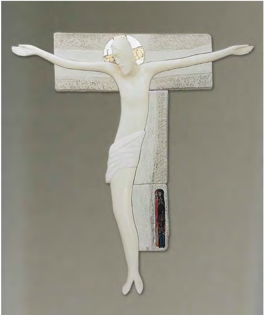
Wasili Wasin, The Crucifix (2010)